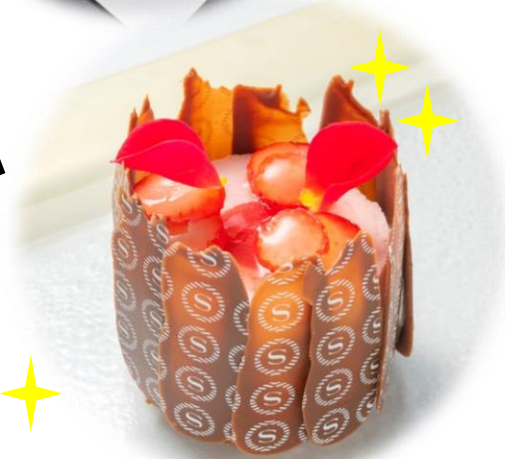
R2年度 シェラトングランドホテル